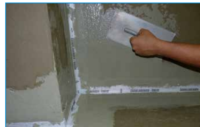
A hajlaterősítés beágyazása után a teljes felületre felhordjuk a második réteg vízszigetelést.