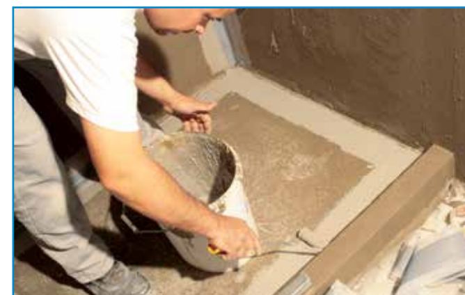
A hajlaterősítő szalag beágyazását az első réteg szigetelés száradása után kezdhethetjük meg.