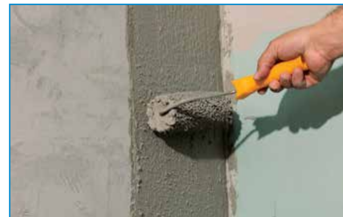
A kenhető szigetelés első rétegét a teljes felületre, sarkokba, élekre is kenjük fel.

Szerszámok: glettvas, korongecset, teddy-henger