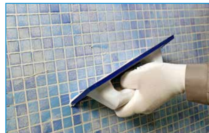
A fugázóanyagot speciális fugázó simítóval juttatjuk a fugákba.