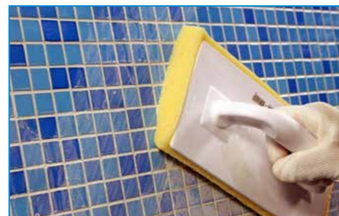
A felesleges anyagot lemosó szivaccsal távolítjuk el a felületről.