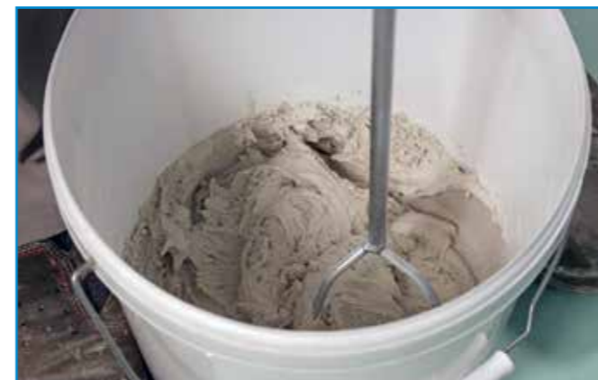
A fugázóanyagot a pontosan kimért komponensek hozzáadásával csomómentesre keverjük.

Az így elkészített felület 24 óra múlva járható, 3 nap után terhelhető, 7 nap után vegyszerálló.