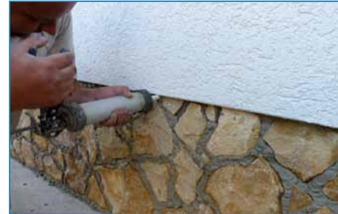
A fugázó anyagot fugázó kanállal vagy kinyomópisztollyal juttatjuk a helyére.

Tisztítás: A burkolatokat lehetőleg a ragasztó száradása előtt, folyamatosan nedves ruhával tisztítjuk.