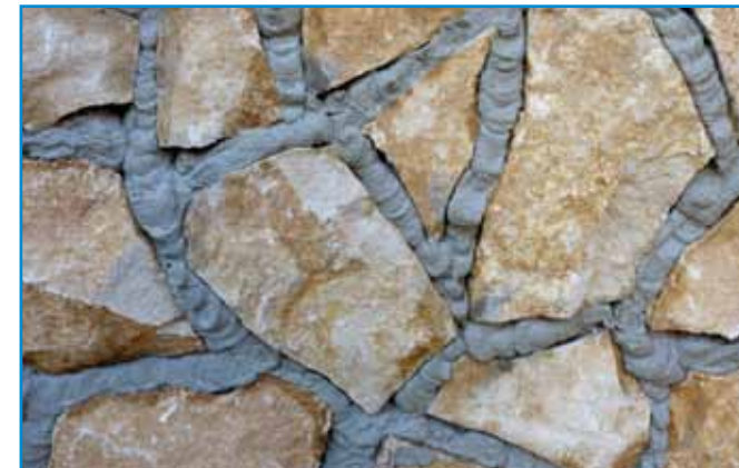
Rövid várakozás után a felesleges anyagot eltávolítjuk.