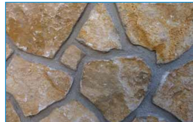
Amikor az anyag kellően meghúzott, ecsettel vagy kefével homogenizáljuk a fugák felületét. A köveket a fugázó teljes megkötése előtt tisztítjuk meg!