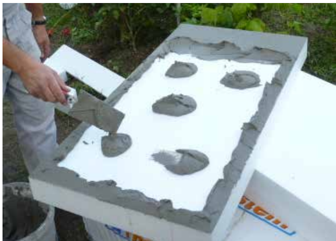
Rendszerragasztó kézi felhordása pont-perem módszerrel

Kézi felhordás esetén a ragasztót a hőszigetelő tábla hátsó oldalára "pont-perem" módszerrel hordjuk fel oly módon, hogy a ragasztó fedje körben a tábla hátsó szélét és még 5 pontban borítsa a hátsó oldalát.