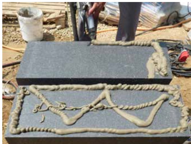
Rendszerragasztó gépi felhordása W-séma szerint

Gépi felhordás esetén a táblák hátoldalára W-séma szerint visszük fel a rendszerragasztót. Ásványgyapot táblák esetén a ragasztási helyeken előzetesen vékony ragasztóréteget kell „bevasalni”, kézzel nagy erővel bepréselni a tábla anyagába. Ragasztó csak az ilyen módon előkezelt helyekre vihető fel!