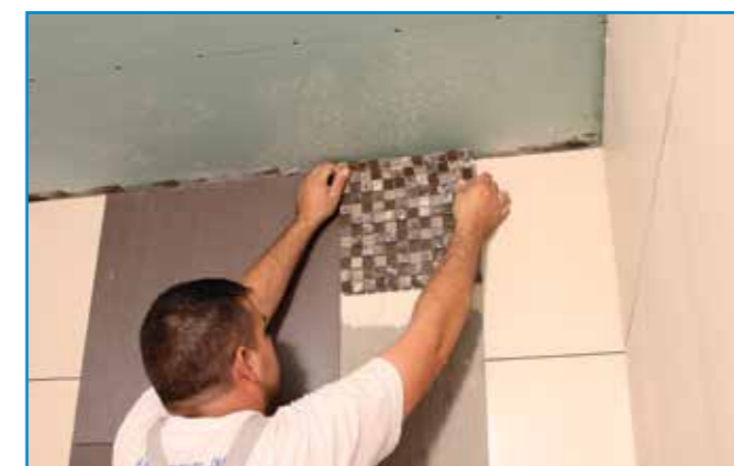
Burkolatváltásnál eltérő lapvastagság esetén a megfelelő fogadósínek kialakítását előzetesen kell elvégezni.