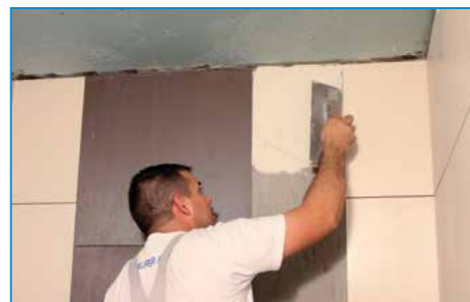
Az üvegmozaik ragasztó felhordását 3 mm-es glettvassal végezzük.